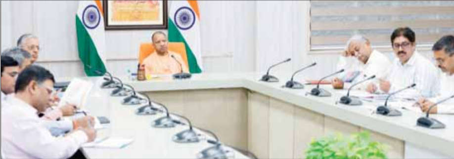
मंगलवार को अपने सरकारी आवास 5-कालिदास मार्ग, लखनऊ में अयोध्या विकास क्षेत्र के मास्टर प्लान के सम्बन्ध में बैठक करते हुए सीएम योगी

महायोजना के बिंदुओं पर विभागीय अधिकारियों से चर्चा करते हुए मुख्यमंत्री ने कहा कि अयोध्या विजन 2047 के अंतर्गत अयोध्या को ग्लोबल आध्यात्मिक नगरी, ज्ञान नगरी, उत्सव नगरी, तीर्थ अनुकूल अवसंरचना, विविधीकृत पर्यटन, ऐतिहासिक सर्किट व हेरिटेज वॉक, हरित एवं सौर ऊर्जा